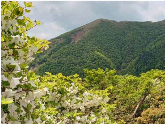
杉峠近くシロヤシオと雨乞岳方向