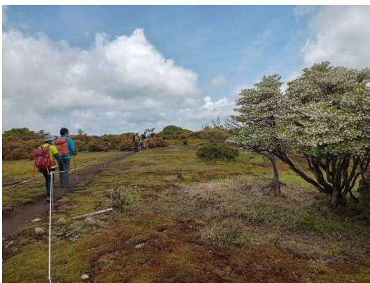
イブネ山頂付近 シロヤシオとアセビ