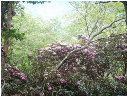
クラシ山頂付近 シャクナゲ